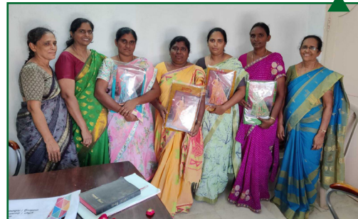
Консультативная встреча жен пасторов прошла в районе Восточный Теланган