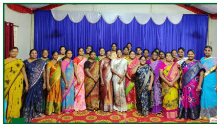
Консультативная встреча жен пасторов в районе Гунтур