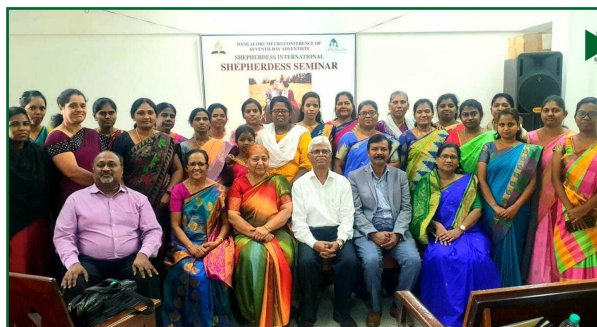
Однодневный семинар для жен пасторов в Южном Центрально-Индийском Унионе в Бангалоре