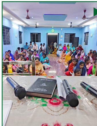
Встреча жен пасторов в районе Северной Андра