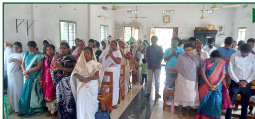
Программа обучения жен пасторов в районе Южной Андра

В конце 2022 года в Дивизионе были проведены обучающие программы и семинары. Ниже представлен краткий отчет.