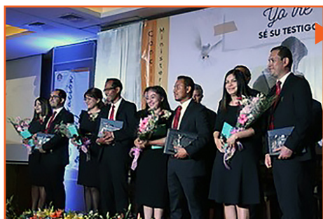
Пять пасторов были рукоположены на торжественной церемонии в Икстапа-Сиуатанехо, Мексика