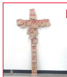
Жены пасторов принесли имена и прикрепили их ко кресту, как акт прощения