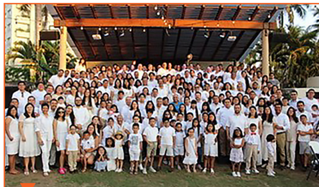
В феврале 2023 года семьи пасторов встретились в Центральной Мексике

Интерамериканского дивизиона. Около 123 семей из пяти областей Униона наслаждались вдохновляющими вестями, общением и сбалансированной программой в райском порту Герреро. В конце съезда состоялась торжественная церемония, на которой были рукоположены пять пасторов.