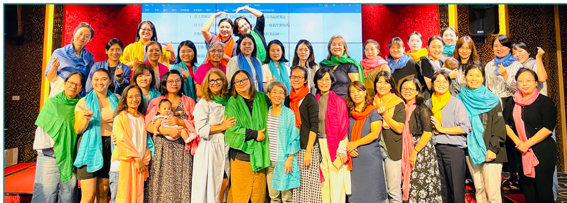
Супруги пасторов собрались для общей фотографии в Тайване

Мы выражаем благодарность Богу за то, что Он руководил ходом этого мероприятия настолько чудесным образом. Благодаря Ему мы можем быть «лучшими версиями себя». «Да будет благоволение Господа Бога нашего на нас, и в деле рук наших споспешествуй нам, в деле рук наших споспешествуй» (Пс. 89:17).