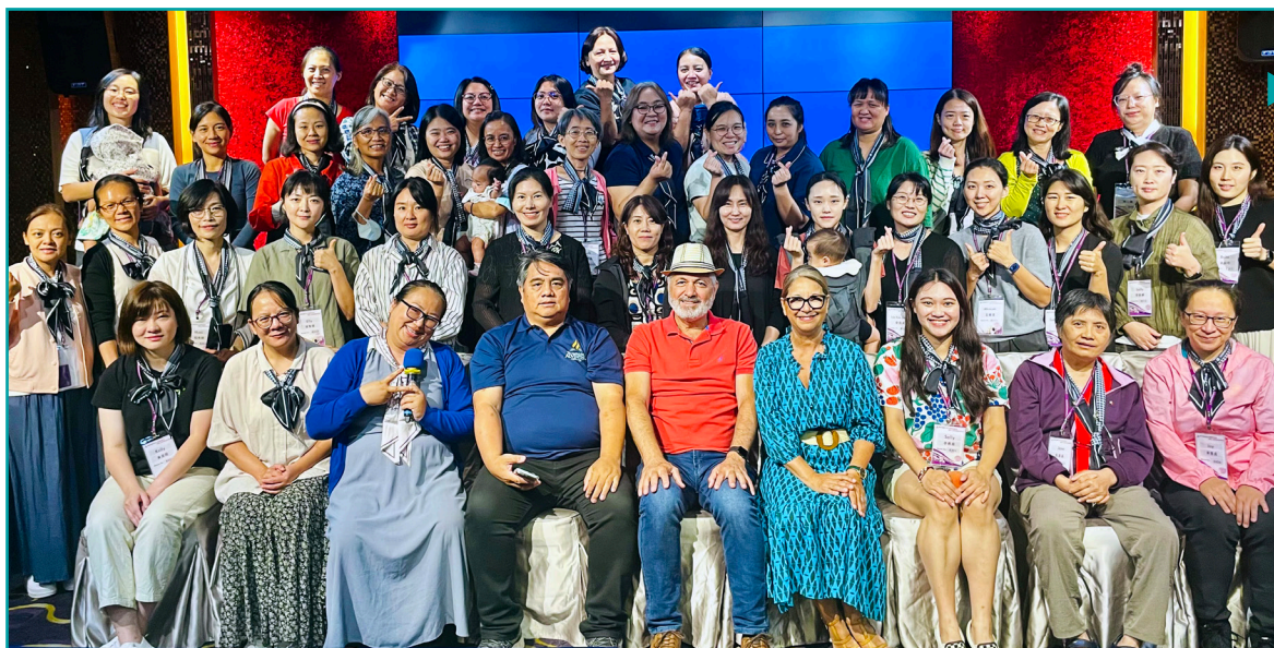
Пасторы с супругами собрались в Тайване на особые встречи в выходные