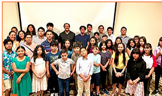
Дети пасторов собрались в Центральном Мексиканском униионе