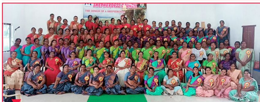
Консультативное совещание в Юго-Восточном Индийском унияне вдохновило для служения 121 жену пастора