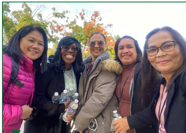
Супруги делегатов, участвовавших в Годичном совещании, с удовольствием посетили музей в Вашингтоне, округ Колумбия